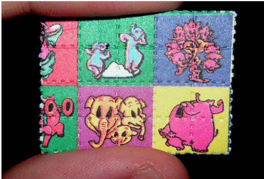
Hình ảnh LSD tại Việt Nam

Tại Việt Nam, những loại chất thức thần được giới trẻ nhắc đến thường là những dạng nhẹ như cần sa, LSD và nấm thần. Nếu như cần sa (tiếng lóng hiện nay gọi là “bò đà”, “bu”, “cò”, “tài mà”, “pin” ...) là loại phổ biến nhất, được sử dụng chủ yếu dưới dạng hút thì LSD (viết tắt của Lysergic acid diethylamide) lại được giới trẻ khá chuộng bởi sự tiện dụng và kín đáo của nó.